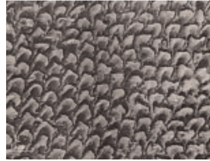
Mikroätzmuster nach dem Auftragen von Methacrylsäure auf den Nagel

mit dem natürlichen, menschlichen Kera- tin genutzt, um einen Verbund zwischen Naturnagel und Gel herzustellen. Die schonende Haftung ohne Säurezusätze er- fordert allerdings eine perfekte Vorberei- tung des Naturnagels und eine fehlerfreie Verarbeitung des Gels. Verarbeitungstech- nische Fehler, die ansonsten durch den Einsatz von Säure kompensiert werden können, werden bei säurefreien Haftme- thoden sofort sichtbar, und zwar oft in Form von Liftings. Dennoch trifft der Ein- satz von schonenden, verträglichen, unbedenklichen Produkten auf ein Bedürfnis und auf das Bewusstsein der heutigen Zeit. Nutzen Sie diesen Vorteil, um sich von Ih- ren Mitbewerbern abzuheben. Im Dschun- gel der Anbieter und Marketingstrategien ist es oft eine Herausforderung, zu erken- nen, welche Gele Säurezusätze enthalten oder nicht. Hier hilft nur ein Blick auf die Liste der Inhaltsstoffe.